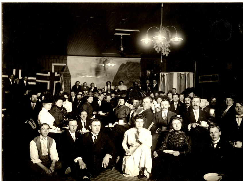
Utvandringa av ungdom til Amerika var omfattande. Biletet er frå "Norsk Ungdomsforening i Spokane, Washington, Omkring 1910, kanskje 17.mai, der minne frå gamlelandet strøynde på.