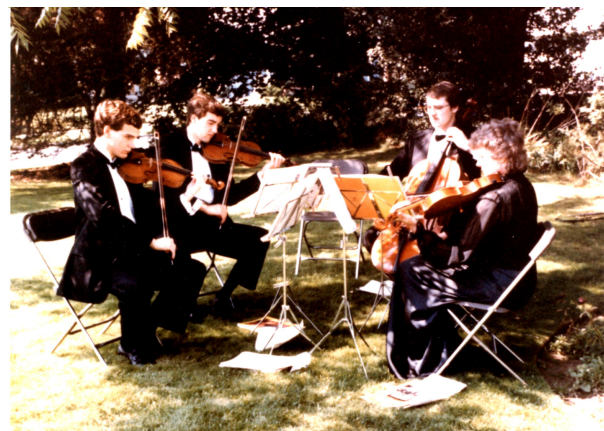
Ei musikarfamilie på høgt nivå.